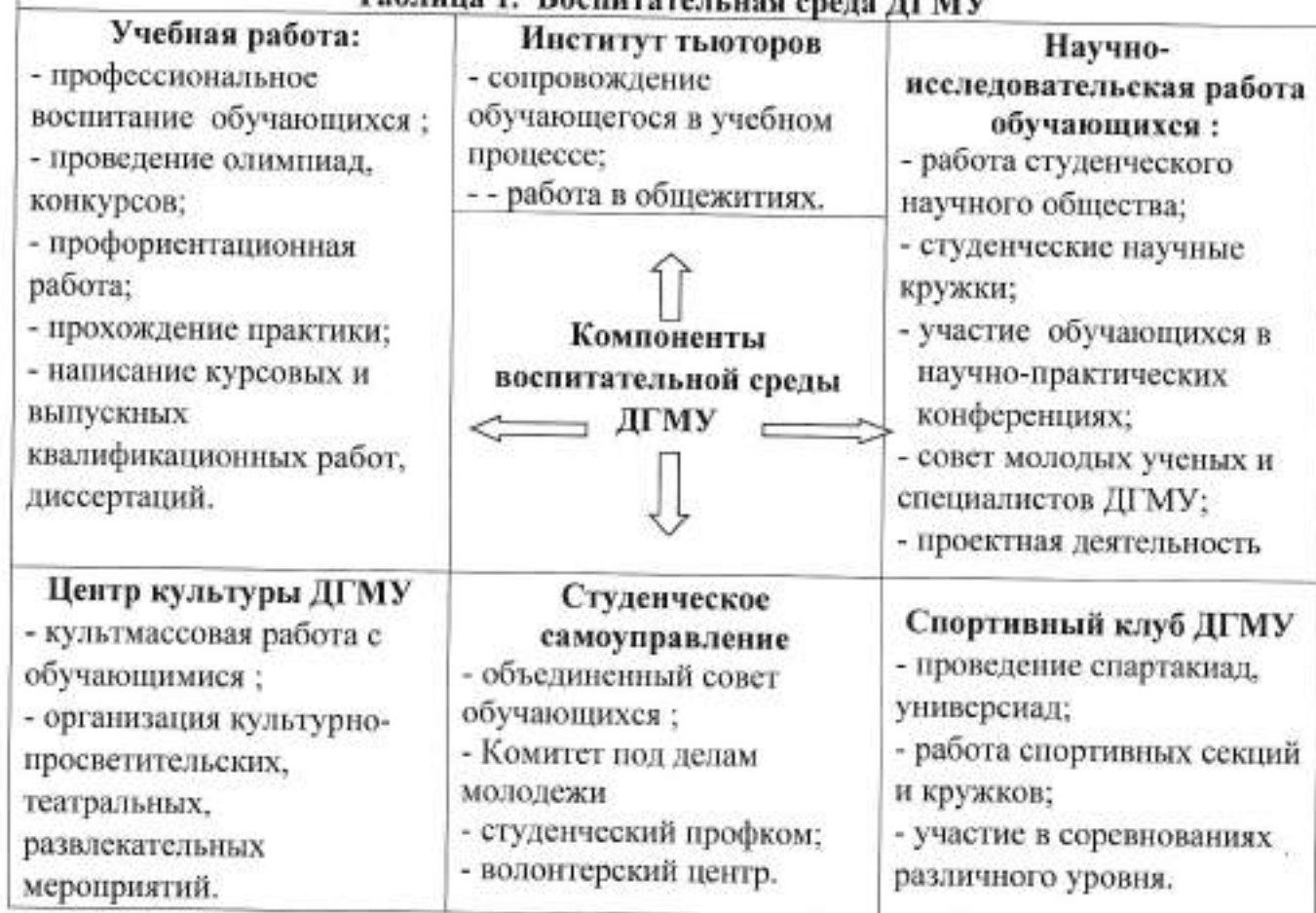
Таблица 1. Воспитательная среда ДГМУ