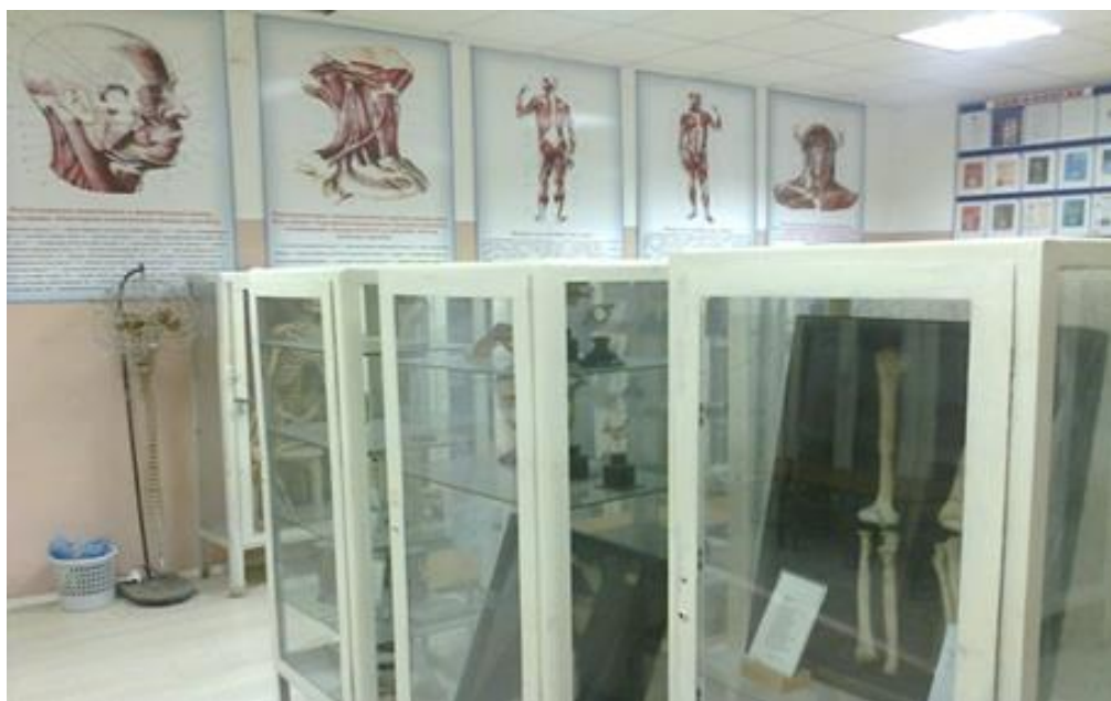
Анатомический музей ДГМУ