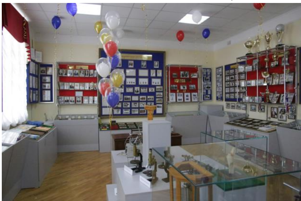
Музей истории ДГМУ