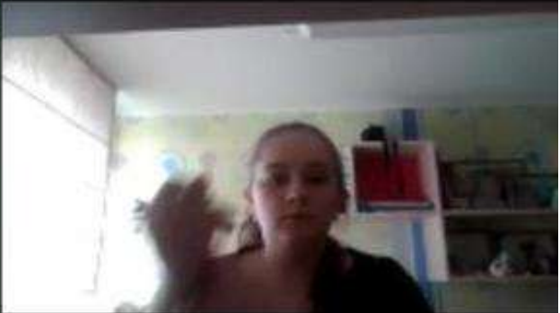
Елизавета Маргарита Кор...