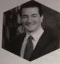
FDA Food and Drug Administration

это Министерство здравоохранения и одна из служб США, один из федеральных выполняет департаментов. Управление имеется контролем качества пищевых продуктов, лекарственных препаратов, эстетических средств, табачных изделий и другие другие категорий товаров, а также осуществляет контроль за соблюдением законодательства и стандартов в этой области.