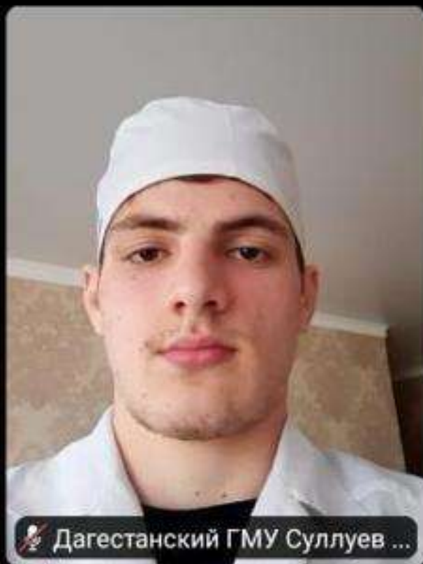
Дагестанский ГМУ Суллаев ...