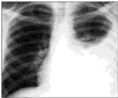
Снимок № 2