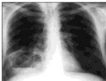
Снимок № 3