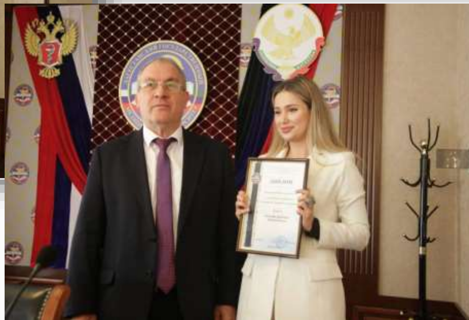
Победители и призёры конкурса